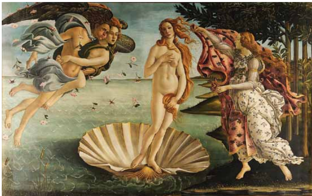
Сандро Боттичелли Рождение Венеры. 1482—1486 г.

экран пространства и воды... Неудивительно, что порой этот город производит впечатление эгоиста, занятого исключительно собственной внешностью. Безусловно, в таких местах больше обращаешь внимание на фасады, чем на наружность себе подобных... Возникновение Санкт-Петербурга было равносильно открытию Нового Света: мыслящие люди того времени получили возможность взглянуть на самих себя со стороны... Совершенная до абсурда архитектура... Город, который начинался как прыжок из истории в будущее... Любая критика человеческого существования предполагает осведомленность критикующего о высшей точке отсчета, лучшем порядке.