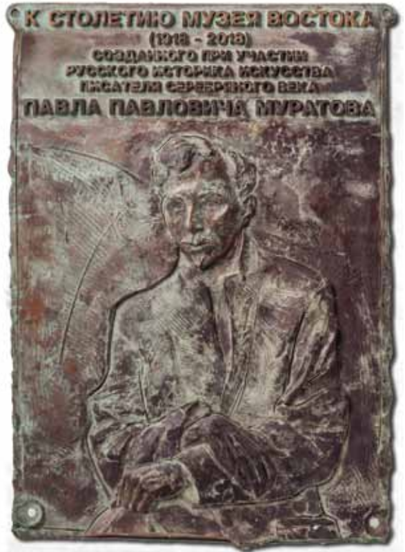
Автор – Кирилл Чижов

История сохранила воспоминание о Лоренцо Медичи как об одном из искуснейших политиков и правителей. Едва ли можно, однако, считать Лоренцо верным продолжателем своего деда Козимо. Его дети были обречены на изгнание, и это показывает, что поли-