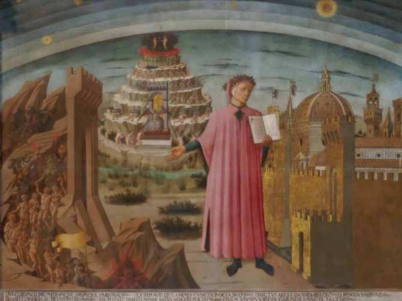
Доменико Микелино (1417–1491) Данте и райский город, фреска

бенно скрыто». Автор сразу говорит, что готов оспорить все главные сомнения в необходимости светской монархии, правящей миром. Для него основополагающим является тезис, что «род человеческий, будучи в состоянии покоя и ничем невозмутимого мира, обладает наибольшей свободой и легкостью совершать свойственное ему дело, почти божественное».