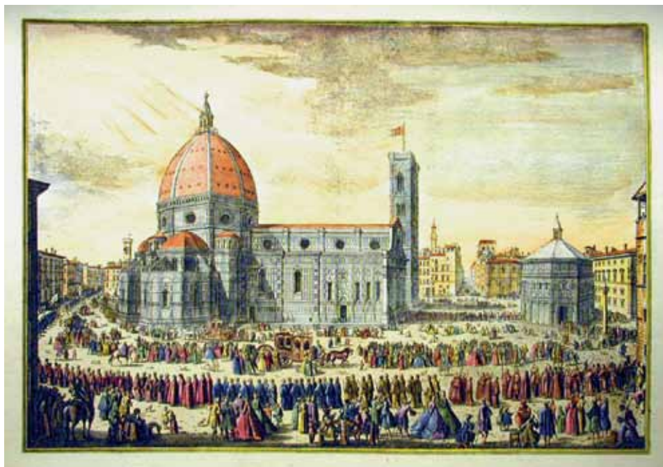
Ведута с видом кафедрального собора Санта Мариа дель Фьоре и Баптистерия

Исследователи Макиавелли должны были понять его религиозно-моральное кредо, четко выраженное в «Рассуждениях», и оценить его значение для определения его истинных взглядов и убеждений, но, по странному стечению обстоятельств, мы не находим такого подхода у многих из них. Как говорил Каструччо Кастракани, один из исторических персонажей Макиавелли, важно не много прочитать, а много запомнить. Иначе как забывчивостью мы не можем объяснить вышеуказанное явление. Приведем еще нравственную позицию Макиавелли, сформулированную в названии главы 10 «Рассуждений». Вот это название: «Сколь доблестны основатели республик или царств, столь же гнусны учредители тирании».