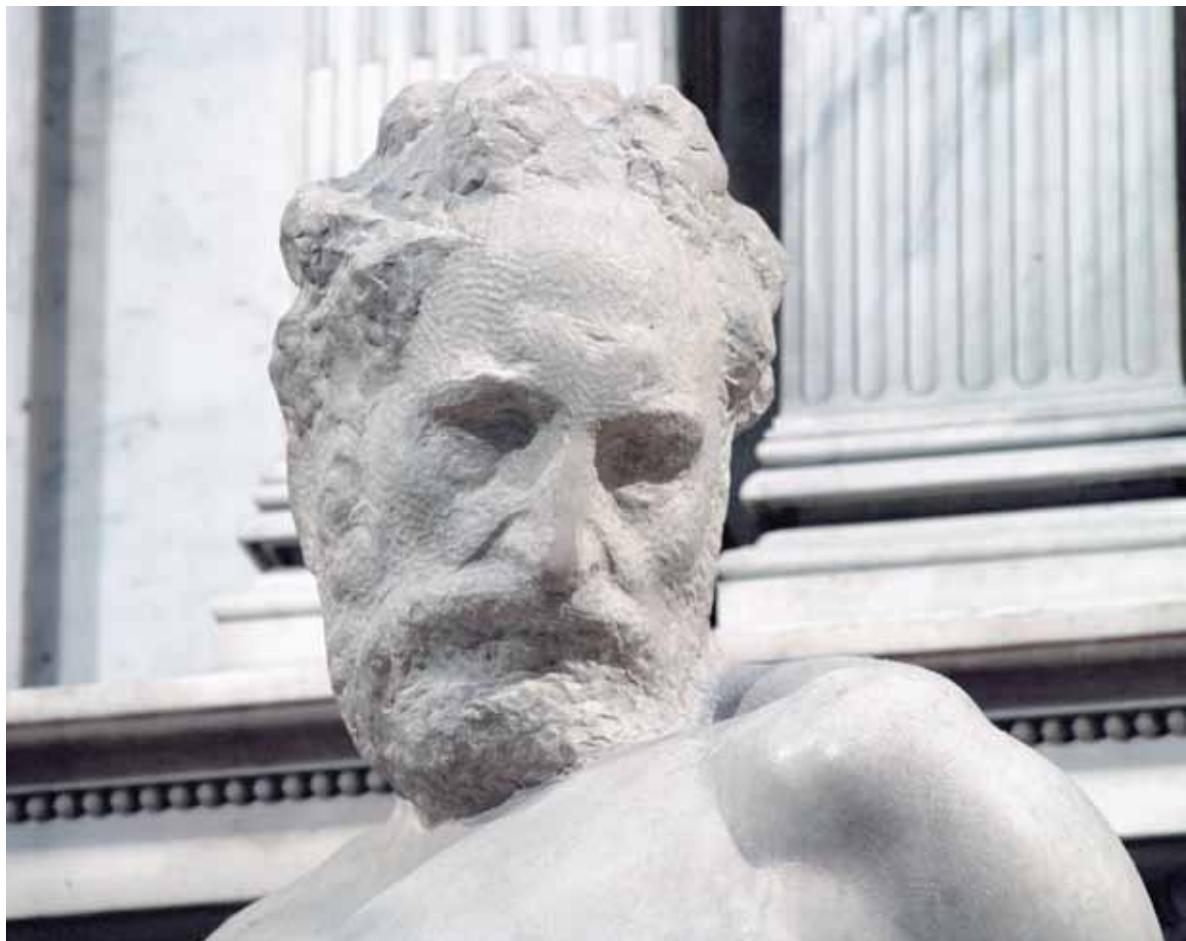
Автор фотографий Капеллы Медичи Сергей Шиян