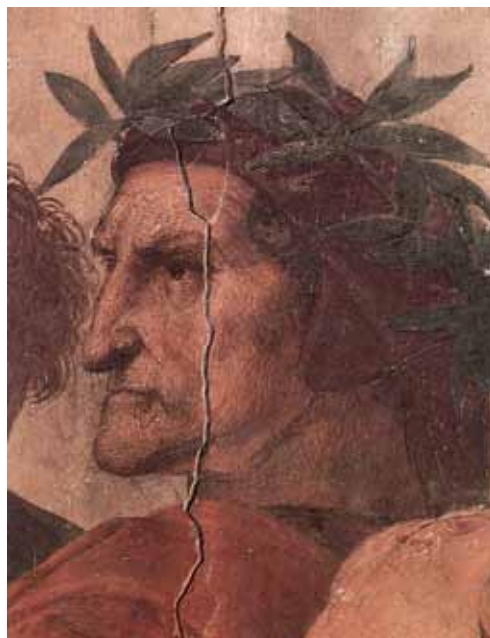
Рафаэль Санти (1483–1520) Данте, фреска в Сикстинской капелле (фрагмент)

Таким требованиям соответствовал только первый в России Московский университет, учрежденный в 1755 году и недавно отме-