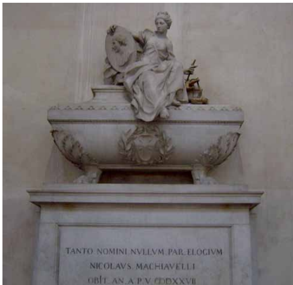
Гробница Никколо Макиавелли Собор Санта-Кроче

тригородских раздоров: «На мой взгляд, ничто не свидетельствует о величии нашего города так явно, как раздиравшие его распри, ведь их было достаточно, чтобы привести к гибели самое великое и могущественное государство. А между тем наша Флоренция от них словно только росла и росла...» 43 . Многократно волнения были связаны с тем, что судебная власть не могла вершить правосудие. Так, руководители влиятельных политических групп противопоставляли себя, в частности, членам Комиссии Восьми, которая с опреде-