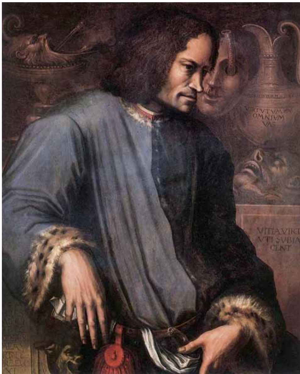
Джорджо Вазари (1512–1514) Портрет Лоренцо Медичи