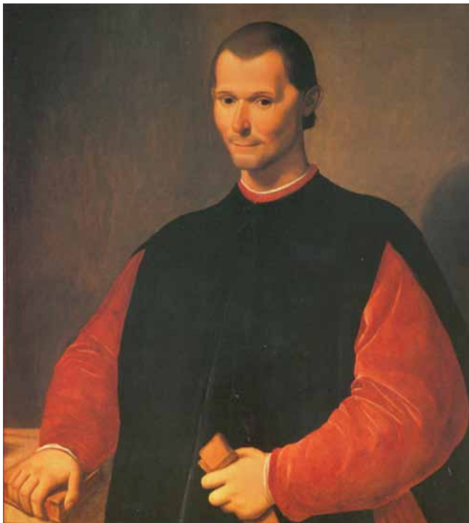
Санти де Тито (1536–1603) Портрет Никколо Макиавелли (фрагмент)

XIII–XV веках. Во-первых, говоря об уставах городов-республик, можем смело упоминать писанные конституции, а при анализе комплекса их законов, регламентирующих порядок организации органов государственной власти, – демократию.