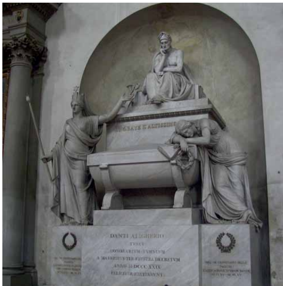
Гробница Данте в соборе Санта-Кроче

тика и монархического конституционного утописта открыл дорогу к осуществлению республиканской конституционной утопии города-коммуны Флоренции в последующем XV веке. Кстати говоря, по свидетельству Макиавелли запрет на возвращение Данте во Флоренцию был персонально оговорен в законе в отличие от большинства других изгнанников. Интересно также, что превозносимый им император Генрих, захватив всю северную Италию и Рим, в течение 50 дней простоял лагерем рядом с Флоренцией в ожидании просьбы о мире и ключей от города, но так и не решился на штурм.