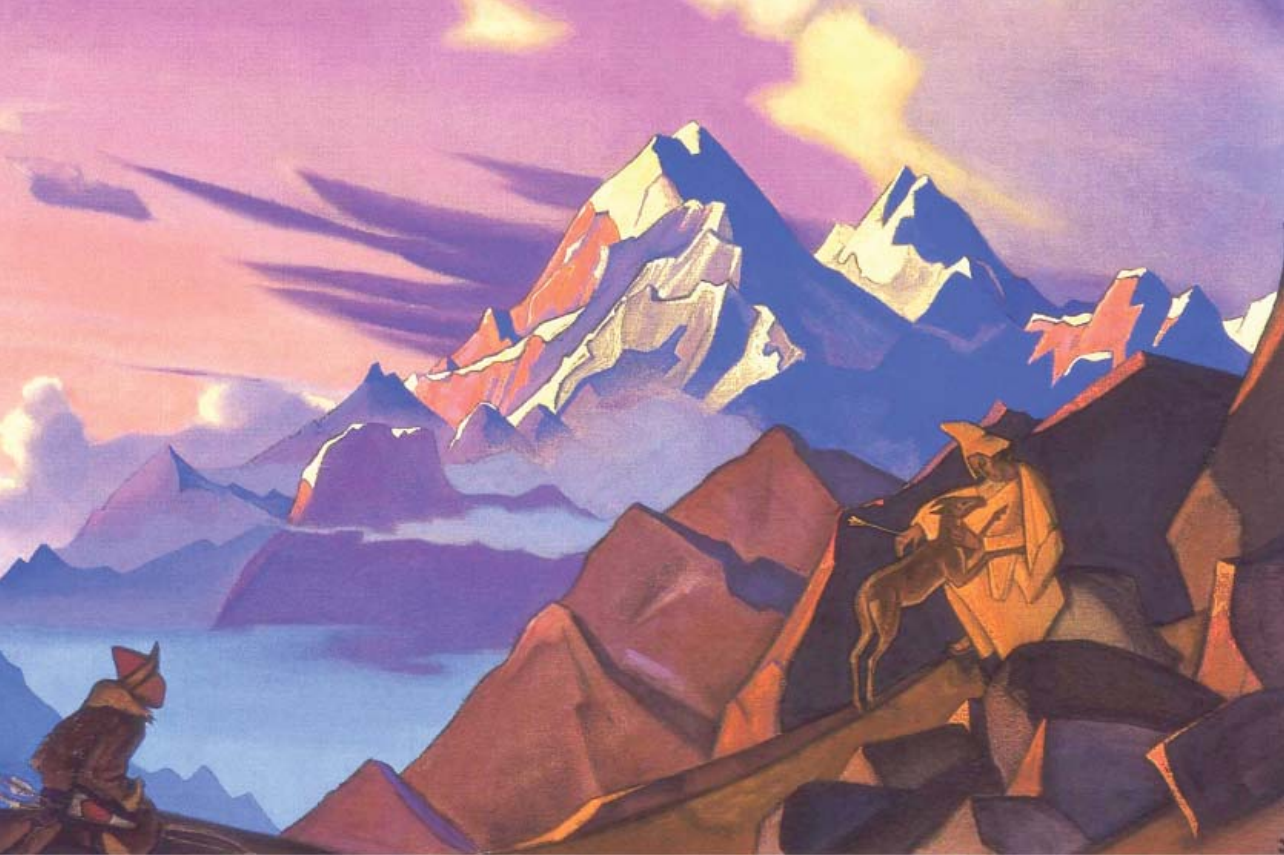
Николай Рерих Сострадание

аналогов в публикациях всех известных мировых философов и может быть названа наиболее полным изложением концепции государства как произведения искусства. Более того, она дает науке конституционного права и философии права необходимые подходы для начала разработки доктрины правового государства, которая, в свою очередь, должна обеспечить конституционную основу Возрождения в России и создания в ней, говоря словами Николая Рериха, «государства будущего» и «цивилизации будущего».