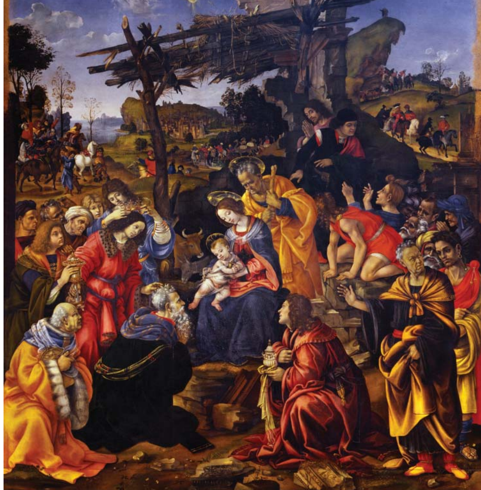
Филиппо Липпи (1406–1469) Поклонение младенцу

нял для того, чтобы иметь возможность вступить за своих друзей и деловых партнеров, высланных из Флоренции. Его лозунгом в политической деятельности всегда был компромисс, но интересы средних и мелких собственников и ремесленников он отстаивал очень твердо. Он извлек много материальных выгод из обслуживания финансов папы Иоанна XXIII, но не задумался истратить в 1418 году свыше трехсот тысяч дукатов на освобождение этого папы из плена, когда тот обнищал и ослаб.