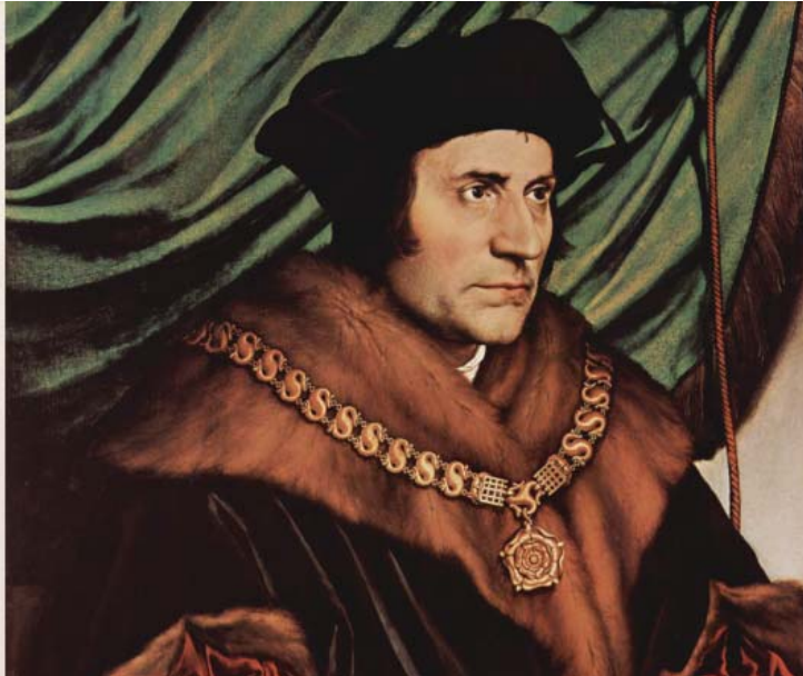
Портрет Томаса Мора кисти Ганса Гольбейна Младшего (фрагмент) и карта страны Утопии из книги «Утопия»

актом европейского Возрождения, его мысль может быть понятна только в связи с признанием Томаса Мора в качестве важнейшей фигуры Ренессанса, черпавшего вдохновение в городах – Брюгге и Флоренции – с одной стороны, и в оптимистических сообщениях из только что открытой Америки – с другой. Он ведь и географически расположил Утопию у берегов Америки.