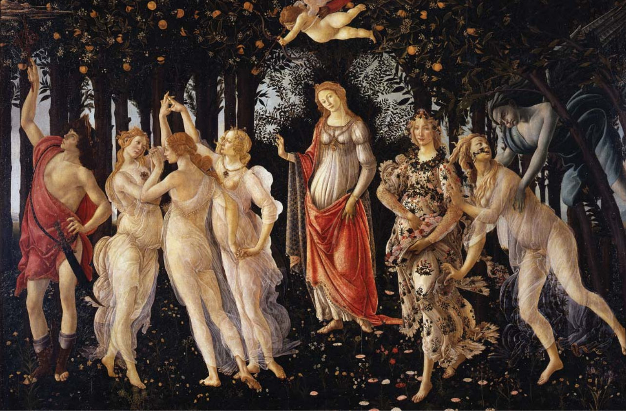
Сандро Боттичелли (1445–1510) Весна