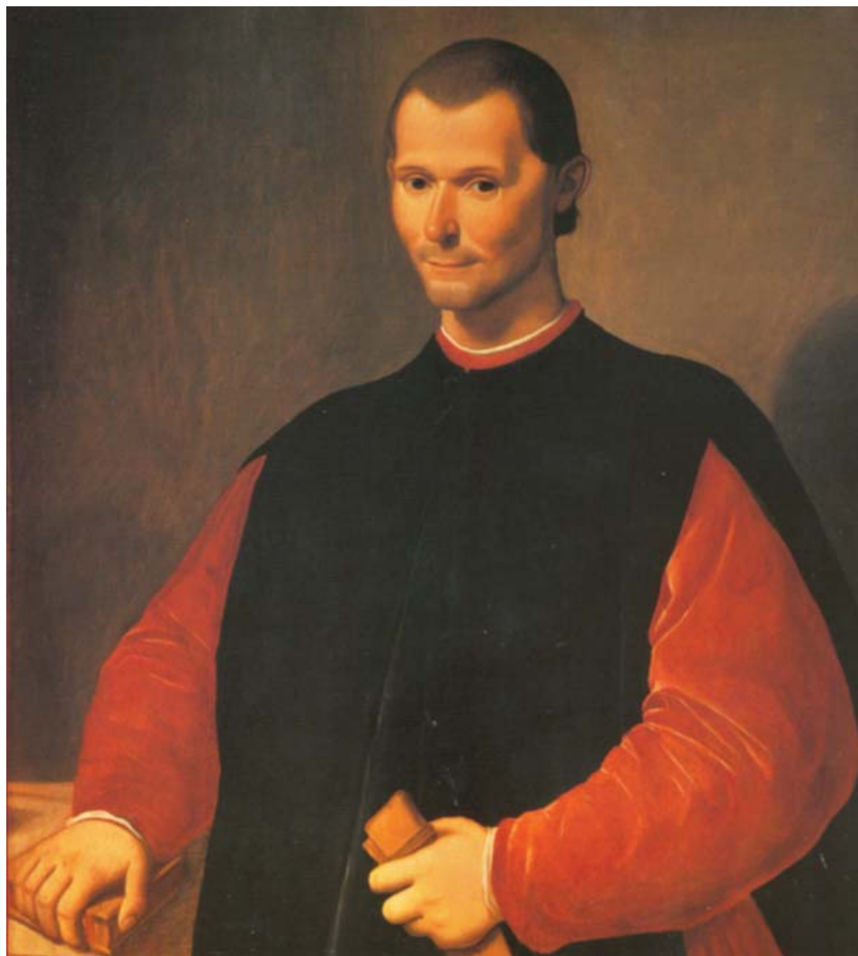
Сантти де Тито (1536–1603) Портрет Никколо Макиавелли (фрагмент)

стрировала торжество всех этих принципов на деле. Как правильно написал английский исследователь Энтони Блэк, события XX века показали, что период Ренессанса представляет отнюдь не антикварный интерес, так как мы можем учиться у истории, поскольку она еще продолжается и мы все еще находимся в ней 6 . Проще говоря, мы и сейчас, в начале XXI века и тре-