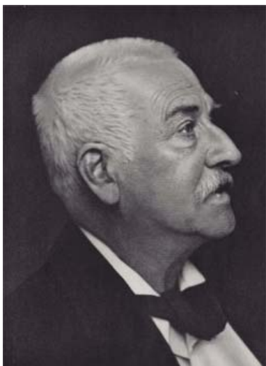
Якоб Буркхардт (нем. Jacob Christoph Burckhardt , 1818–1897)

рины гуманизма, а увидят свой день и, как ходячая звонкая монета, пойдут по рукам, когда настанет срок».