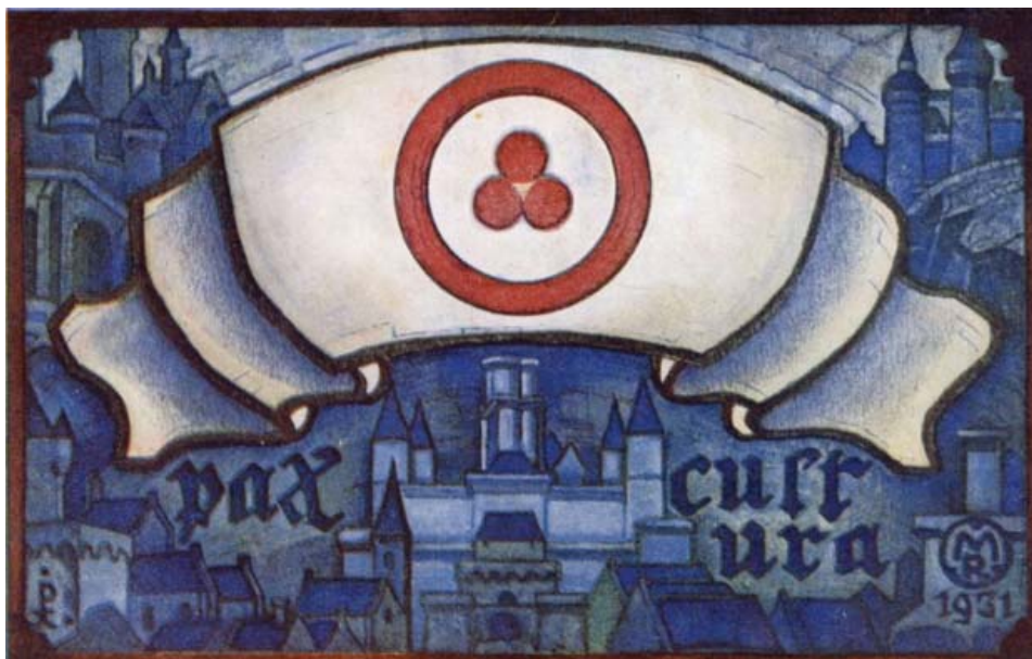
Николай Рерих Pax Cultura

ков и институтов, указанных в статье первой», обеспечиваются принятием «внутреннего законодательства, необходимого для обеспечения защиты и уважения»). Здесь Пакт Рериха, подписанный 21 государством в кабинете президента США Франклина Рузвельта в Белом доме, пошел дальше проекта Пакта 1928 года, где не говорится о мирном времени и не выделены в отдельную категорию образовательные институты. В проекте Пакта последние упомянуты только в Преамбуле применительно к общему понятию защищаемых объектов, что несколько ослабляет четкость защиты. (Хотя предусмотренная проектом защита передвижных коллекций не нашла отражения в тексте Пакта Рериха 1935 года.)