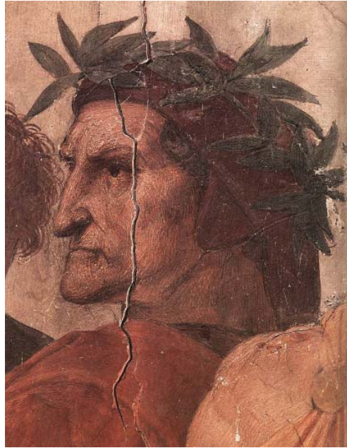
Рафаэль Санти (1483–1520) Данте, фреска в Сикстинской капелле (фрагмент)

да не возвращающий поглощенное. Итак, поразмыслив об этом не раз наедине с собою, дабы не заслужить когда-либо обвинения в сокрытии таланта, я возымел желание не столько копить сокровища, сколько принести полезный плод обществу, открыв ему истины, не исследованные другими... А так как среди прочих сокровенных и полезных истин понятие о светской Монархии является полезнейшим и оно особенно скрыто, не будучи доступно всем, поскольку не имеет оно непосредственного отношения к житейской выгоде, я ставлю своей задачей извлечь его из тайников, как для того, чтобы без устали трудиться на пользу мира, так и для того, чтобы первому стяжать пальму победы в столь великом