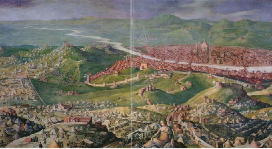
Джорджо Вазари (1511–1574) Вид Флоренции. 1558

на прочувствованном восприятии флорентийских (фрязинских) творений, но не в Петербурге, а в Москве.