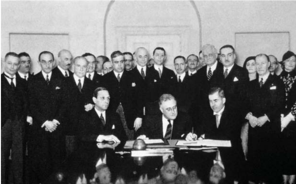
Подписание Пакта Рериха в Белом Доме (Вашингтон). 15 апреля 1935 г.

снизит уровень насилия как внутри государств, так и в межгосударственных отношениях.