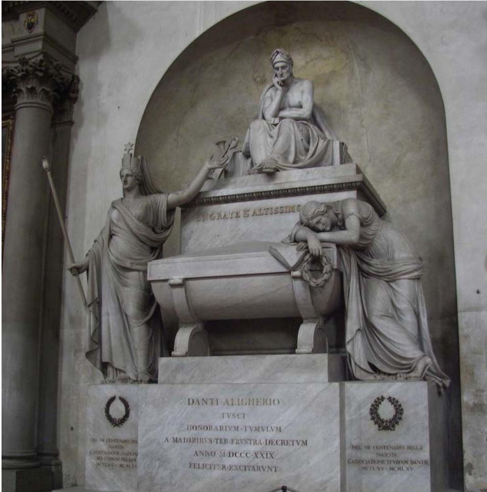
Гробница Данте в соборе Санта-Кроче

что ушедшая в детали и полная скептицизма, а также ложного чувства превосходства современная наука не уделила достаточного внимания ценности флорентийского утопизма для человечества времен начала третьего тысячелетия.