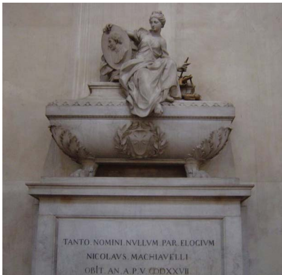
Гробница Никколо Макиавелли Собор Санта-Кроче

ской премии в 1986 году. Во-вторых, обратим внимание на те моменты, которые подтверждают схожесть новых явлений современности с практикой голосования малых городов-коммун прошлого. Последние выборы в США решались пересчетом голосов в небольших избирательных округах Флориды, где разница шла на сотни и десятки голосов, практически как в Древних Афинах и Риме.