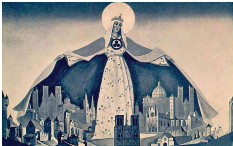
Николай Рерих Мадонна-защитница

перевода эстетические концепции государства, например в творчестве знаменитого русского мыслителя и художника Николая Рериха, который продолжил и развил в глубокую и практически выполнимую доктрину лозунг, выдвинутый Достоевским: «Красота спасет мир!». Отсюда начинается мощное русское направление в развитии концепции эстетической государственности, оставшееся пока за пределами внимания отечественной юридической науки. Изучение философско-правового наследия Рериха важно для разработки доктрины правового государства, в первую очередь, в связи с тем, что им выдвинута основополагающая и наиболее характерная черта правового государства, без которой сама возможность разработки доктрины на современном этапе может стать недостижимой.