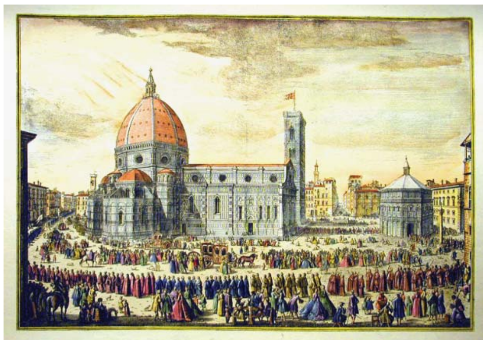
Ведута с видом кафедрального собора Санта Мария дель Фьоре и Баптистерия

он отдавать реальное предпочтение античным религиям, как не мог желать введения спартанских государственных порядков в жизнерадостной и христианской Флоренции. Макиавелли был, в первую очередь, практик и реалист, несмотря на то, что при этом он был немного и мечтателен, и утопичен. Когда он говорил о значении религии, он хотел видеть восстановление первичных библейских ценностей, которые могли укрепить в его современниках-согражданах стремление к свободе и доблести. Вероятно, с этим связано его уважительное отношение к монаху Савонароле, а также включение Моисея в ряд исторических героев, достойных подражания.