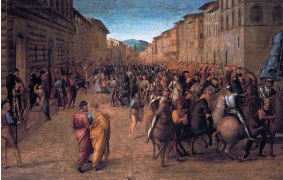
Франческо Граначчи (1469–1543) Вхождение войска Карла VIII во Флоренцию

книги Буркхардта. Величайшим собственным, а не скопированным с западных образцов достижением российской правовой мысли, возможно, за всю ее историю, является концепция взаимосвязи государства и культуры, которую мы назвали концепцией эстетической государственности Николая Рериха. Она не только важна для построения в XXI веке в России правового государства, к чему обязывает статья 1 Конституции РФ, но и требует осмысления ее корней и истоков, из которых важнейшими являются идеи швейцарского мыслителя XIX века Якоба Буркхардта, который умер в Базеле в 1897 году, а на следующий год Рерих закончил юридический факультет Санкт-Петербургского университета (а заодно и Академию художеств). Более подробно о концепции Рериха мы написали в книге «Пакт Рериха в 21 веке» (Летний сад, М., 2010).