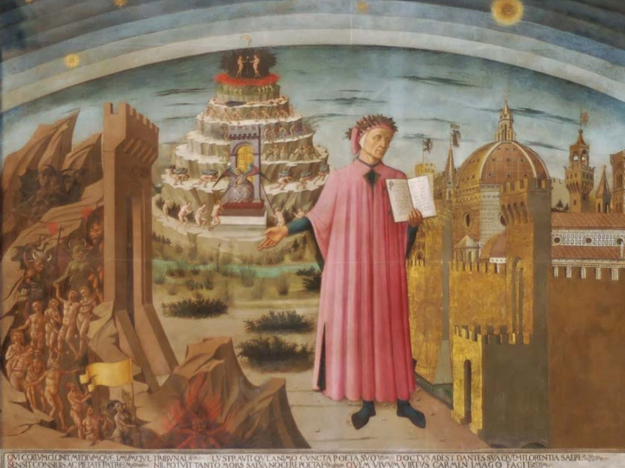
Доменико Микелино (1417–1491) Данте и райский город, фреска

ведении величайшего поэта Италии, некогда изгнанного из Флорентийской республики, с современной ему республикой под руководством Лоренцо Медичи Великолепного, период правления которого называют «золотым веком» города-коммуны.