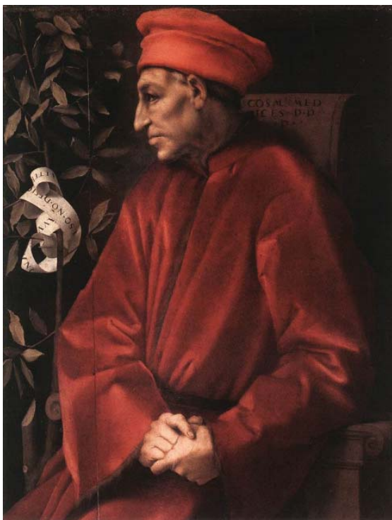
Портрет Козимо Медичи Старшего Флоренция, галерея Уффици