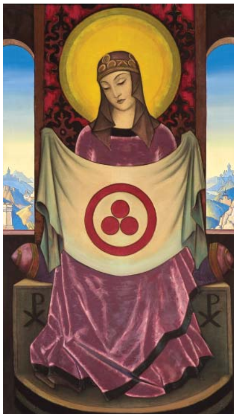
Николай Рерих Мадонна Орифлама

Во-первых, Николай Рерих – по образованию юрист, защитивший в Петербургском университете дипломную работу на тему «Правовое положение художников в Древней Руси» в 1898 году. Во-вторых, на базе его эстетической концепции государства еще при его жизни и непосредственном участии были в десятках стран приняты новые законы и заключены важные международные соглашения, чем мало кто из мыслителей может похвастаться. В-третьих, его мысли дают решающие подходы для построения доктрины правового государства, пока что по-настоящему не разработанной вообще и применительно к российским условиям в частности, по авторитетному мнению председателя Конституционного суда РФ В. Д. Зорькина.